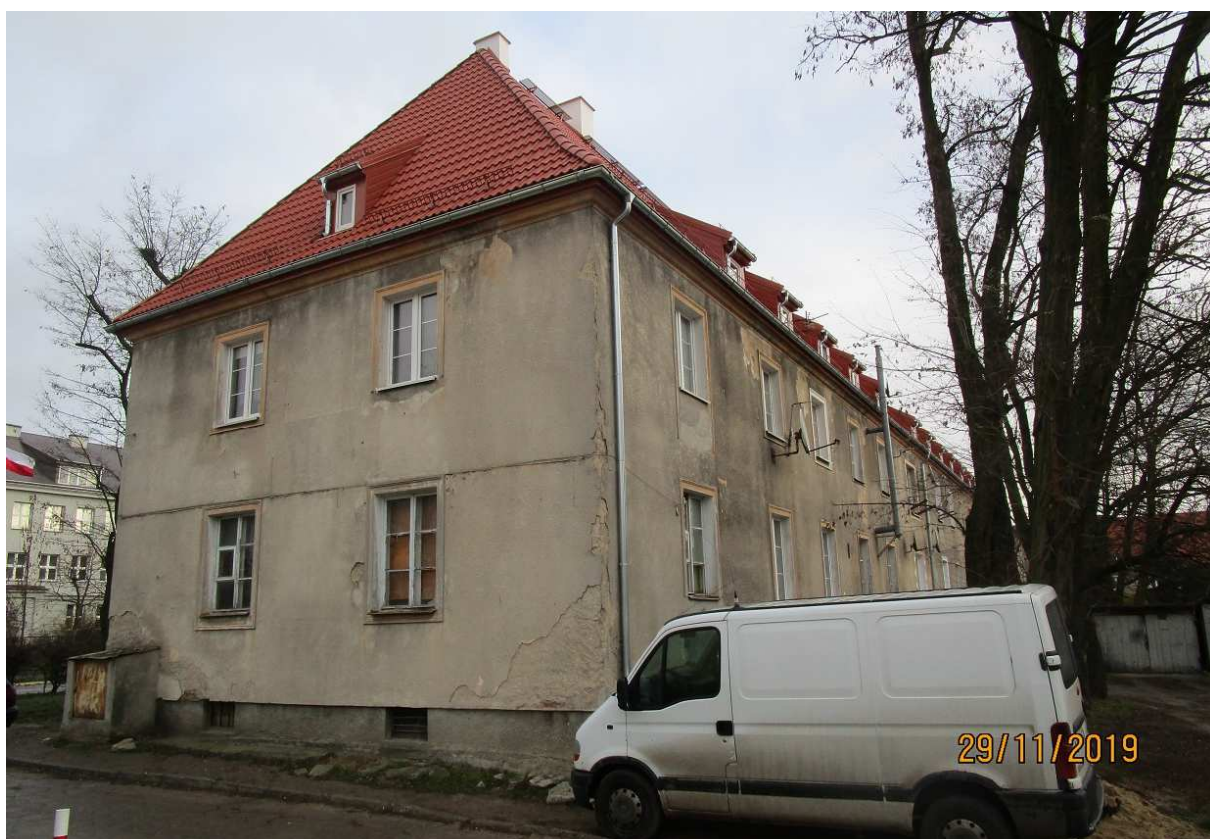
Foto 2 Widok ogólny na elewację