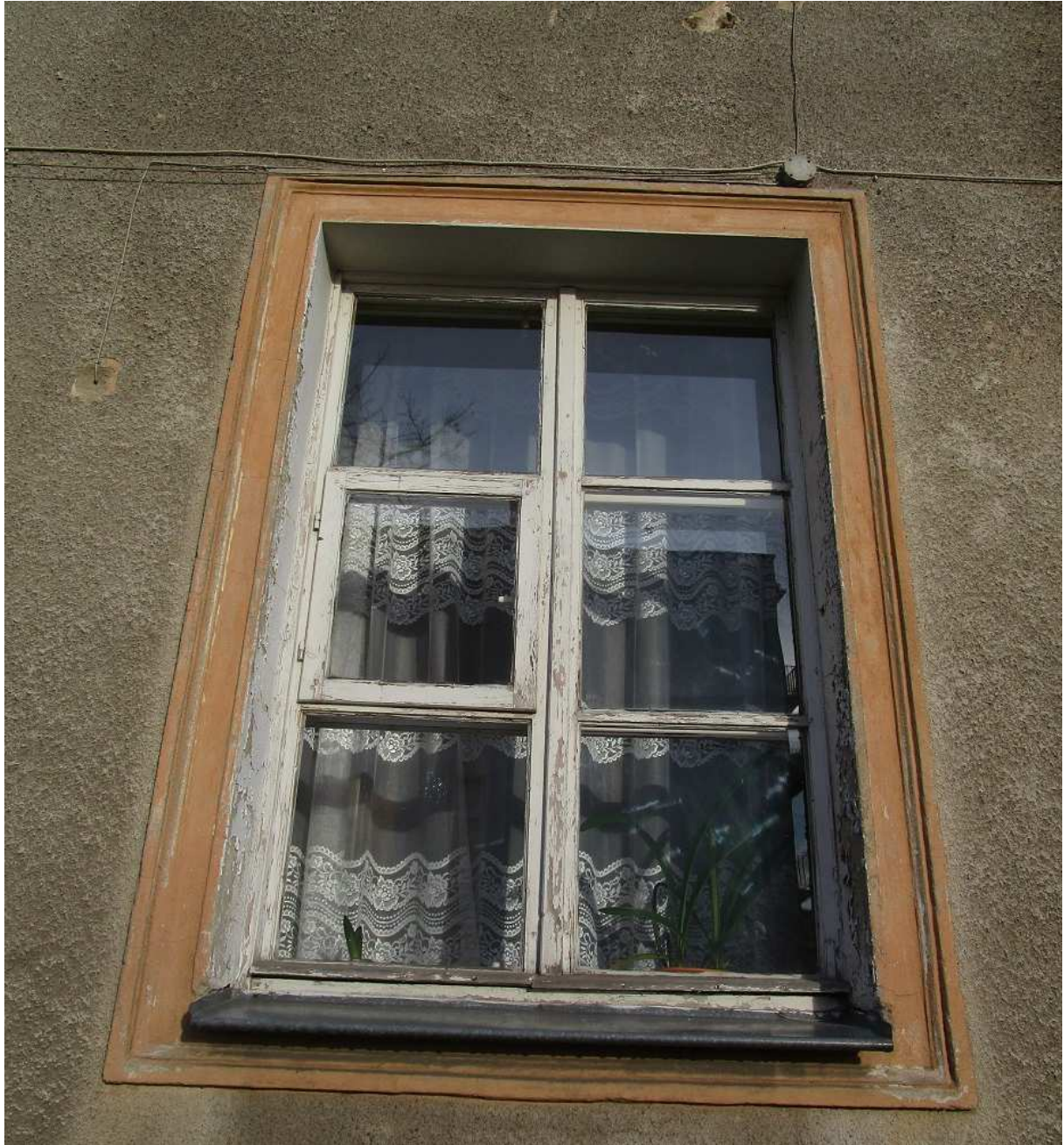
Foto 3 Widok na jedno ze starych okien przeznaczonych do wymiany

W budynku podczas wcześniejszych prac remontowych w częściach mieszkalnych wymieniono stolarkę okienną na nową w kolorze białym. Obecnie projektuje się wymianę czterech starych drewnianych okien w lokalach mieszkalnych nr 17 i 15B. Okna nie posiadają ozdób, parapet wewnętrzny drewniany zaś zewnętrzny z blachy cynkowanej surowej. Wszystkie stare zniszczone drewniane okna w złym stanie technicznym kwalifikujące się do wymiany.