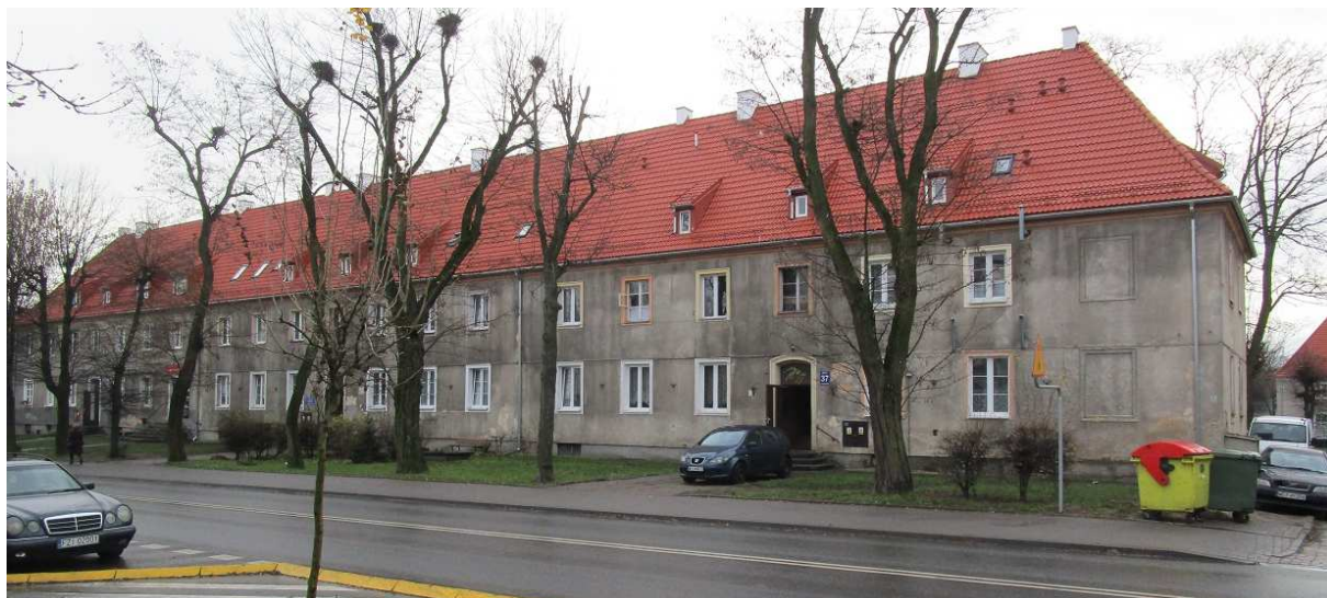
Foto 1 Widok ogólny na elewację

Budynek murowany posiada dwie kondygnacje nadziemne i jedną podziemną oraz poddasze użytkowe. Budynek wzniesiony metodą tradycyjną z cegły ceramicznej w latach 1940 - 44. Dach wielospadowy.