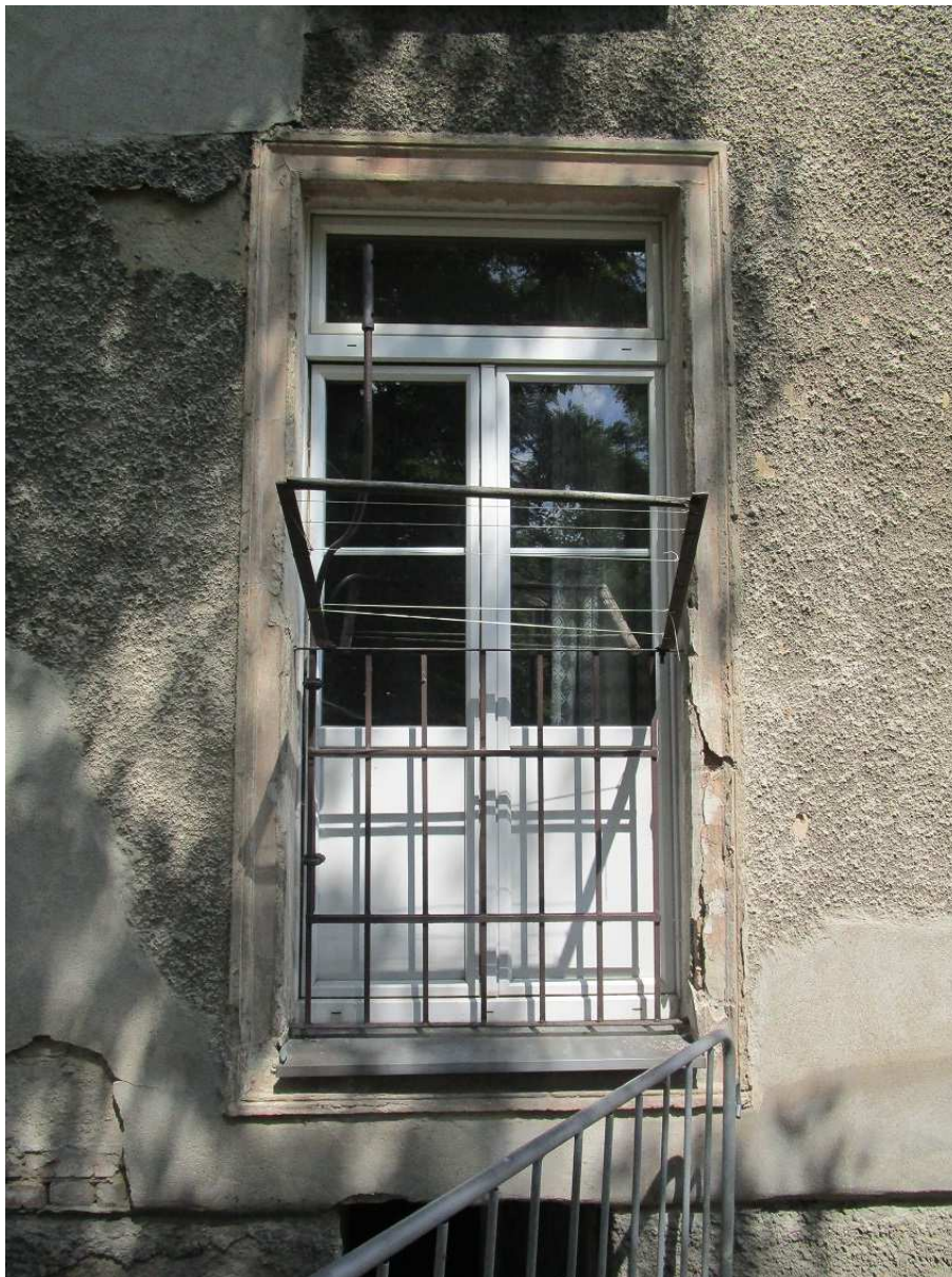
Foto 2 Widok na jedno ze starych okien przeznaczonych do wymiany