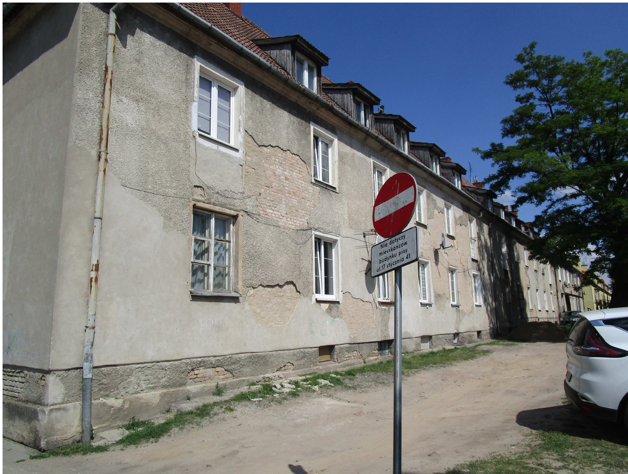
Foto 1 Widok ogólny na elewację

Budynek murowany posiada dwie kondygnacje nadziemne i jedną podziemną oraz poddasze użytkowe. Budynek wzniesiony metodą tradycyjną z cegły ceramicznej w latach 1940 - 44. Dach wielospadowy.