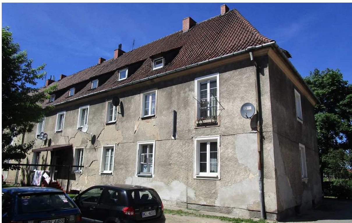
Foto 2 Widok ogólny na elewację