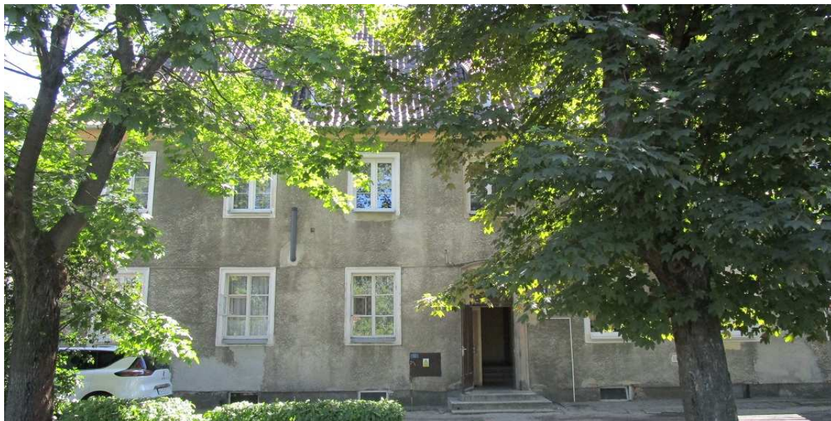
Foto 1 Widok ogólny na elewację

Budynek murowany posiada dwie kondygnacje nadziemne i jedną podziemną oraz poddasze użytkowe. Budynek wzniesiony metodą tradycyjną z cegły ceramicznej w latach 1940 - 44. Dach wielospadowy.