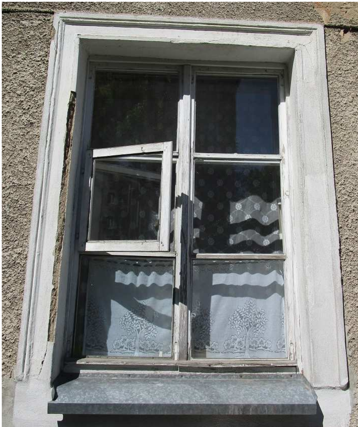
Foto 3 Widok na jedno ze starych okien przeznaczonych do wymiany

W budynku podczas wcześniejszych prac remontowych w częściach mieszkalnych wymieniono stolarkę okienną na nową w kolorze białym. Obecnie projektuje się wymianę trzech starych drewnianych okien w lokalu mieszkalnym nr 1. Okna nie posiadają ozdób, parapet wewnętrzny drewniany zaś zewnętrzny z blachy cynkowanej surowej. Wszystkie stare zniszczone drewniane okna w złym stanie technicznym kwalifikujące się do wymiany.