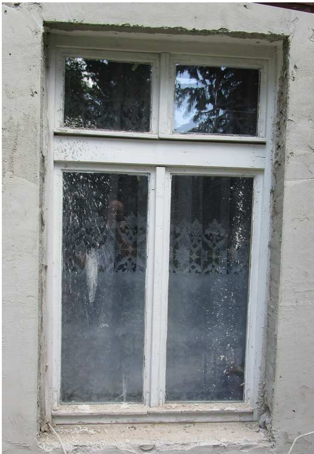
Foto 2 Widok na jedno ze starych okien przeznaczonych do wymiany