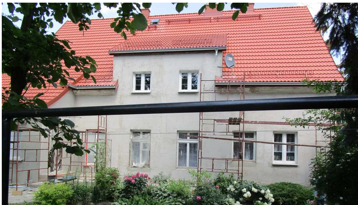
Foto 1 Widok ogólny na elewację

Budynek murowany posiada dwie kondygnacje nadziemne i jedną podziemną oraz poddasze użytkowe. Budynek wzniesiony metodą tradycyjną z cegły ceramicznej w latach 1940 - 44. Dach wielospadowy.