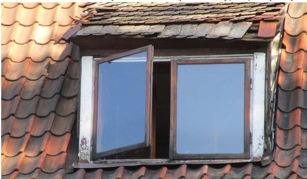
Foto 2 Widok na jedno ze starych okien przeznaczonych do wymiany

W budynku podczas wcześniejszych prac remontowych w częściach mieszkalnych wymieniono stolarkę okienną na nową w kolorze białym. Obecnie projektuje się wymianę trzech starych drewnianych okien w lokalu mieszkalnym nr 11A. Okna nie posiadają ozdób, parapet wewnętrzny drewniany zaś zewnętrzny z blachy cynkowanej surowej. Wszystkie stare zniszczone drewniane okna w złym stanie technicznym kwalifikujące się do wymiany.