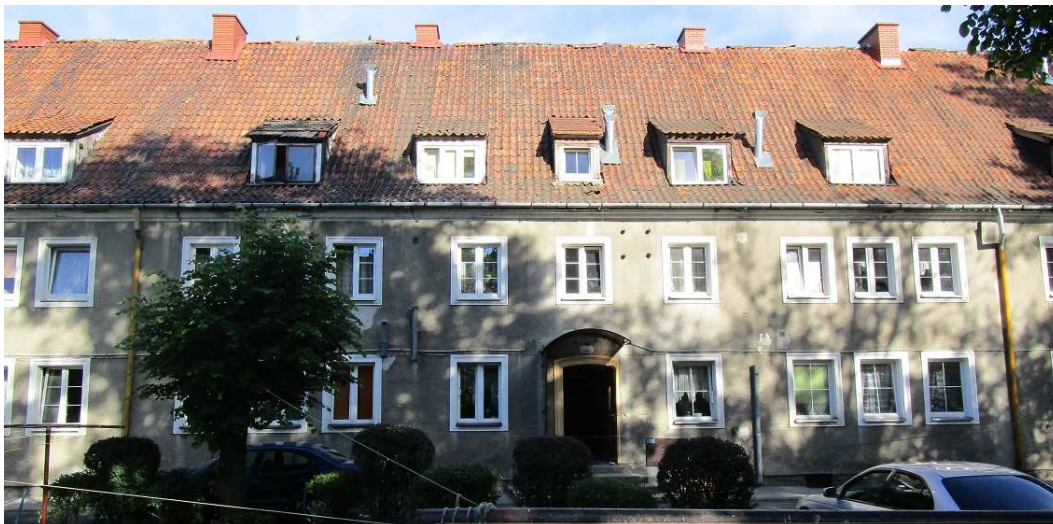
Foto 1 Widok ogólny na elewację

Budynek murowany posiada dwie kondygnacje nadziemne i jedną podziemną oraz poddasze użytkowe. Budynek wzniesiony metodą tradycyjną z cegły ceramicznej w latach 1940 - 44. Dach wielospadowy.